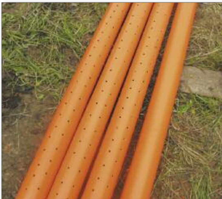
Оросительные и дренажные трубы

Для наращивания специфической микрофлоры, осуществляющей анаэробное сбраживание образующегося в септике осадка и ускорения процесса пуска новых септиков, в них загружают зрелый осадок давно работающего септика из расчета 15 л/чел.