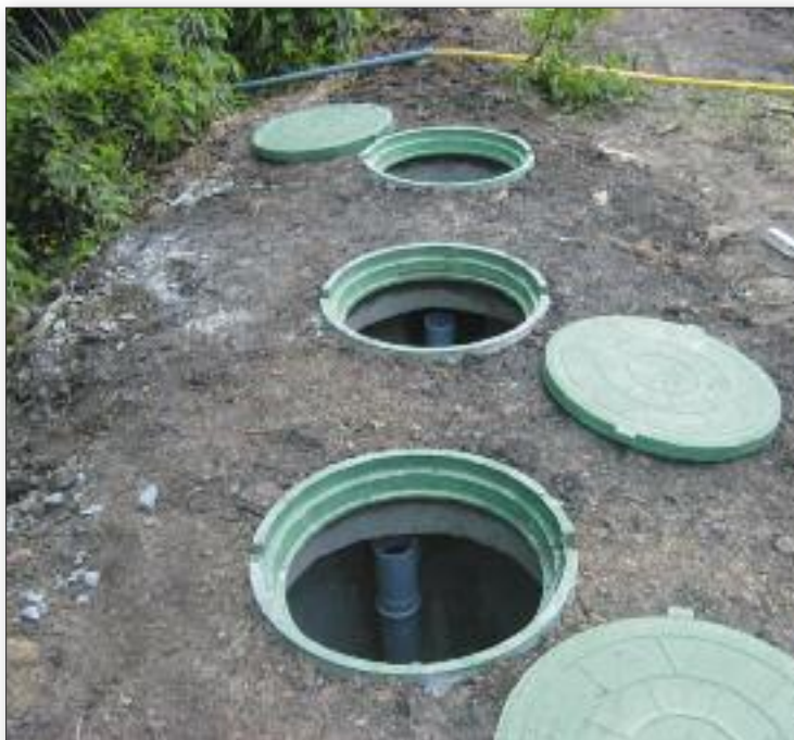
Трехкамерный септик с открытыми люками

8. Разделение стоков на «серые» (хозяйственно-бытовые) и «черные» (фекальные) с их разделением в различные камеры многокамерного септика и дальнейшей почвенной фильтрацией. Подача только «черных» стоков на аэрационные установки.